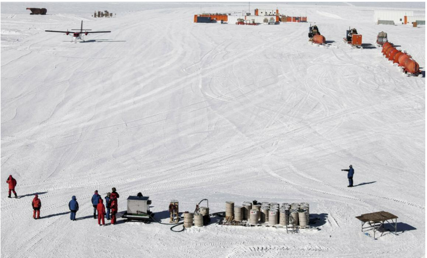
Forscher auf der Antarktis-Station Concordia: Training schützt vor Lagerkoller

trum für Neurodegenerative Erkrankungen in Dresden: „Wer Sport treibt, tut mehr für sein Gehirn als jemand, der den ganzen Tag lang im Sessel sitzt und angestrengt denkt.“