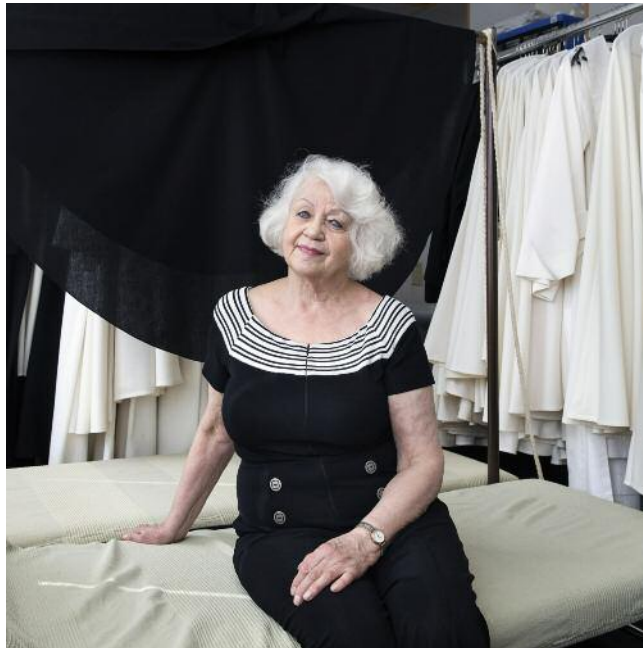
Komparsin Cezanne: „Es hat klick gemacht“

52 Menschen haben an der Studie des Max-Planck-Instituts teilgenommen; das durchschnittliche Alter lag bei 66 Jahren.