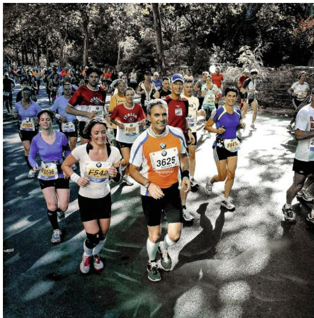
Marathonteilnehmer in Berlin: „Dem geistigen Abbau davonlaufen“

Gegen Alzheimer sind zwar Mittel („Cholinesterasehemmer“) auf dem Markt; doch deren Gabe ist umstritten, weil die „Behandlungseffekte klein sind und in der Praxis nicht immer in Erscheinung treten“, wie es in der aktuellen Ausgabe des „Arzneiverordnungs-Reports“ heißt. Ein Nutzen für die Lebensqualität ist nicht bewiesen, auch Aufenthalte in Pflegeheimen lassen sich durch die Mittel nicht vermeiden.