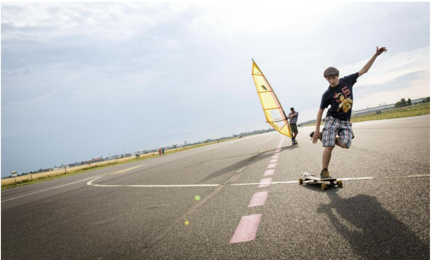
Skater in Berlin: Regelmäßiger Sport führt zu besseren Schulnoten

Jahren ergeben hat: Im Vergleich zu trägen Probanden war das Gehirn aktiver Menschen weitaus leistungsfähiger.